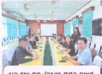
ผอ.รพ.สต./จนท.สตอ.กพส.