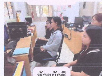
ห้วยผักชี