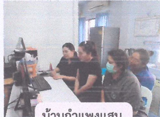
บ้านกำแพงแสน