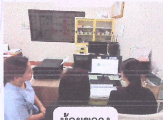
ห้วยขวาง