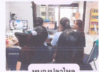
หนองปลาไหล