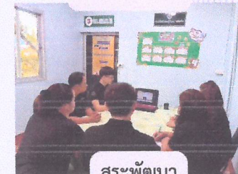
สระพัฒนา