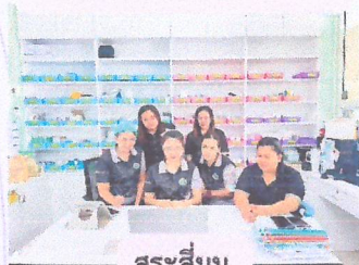
สระสี่มุม