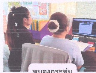
หนองกระทุ่ม