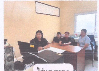
ไร่แดงทอง