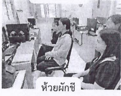
ห้วยผักชี