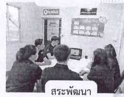
สระพัฒนา