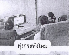
ทุ่งกระพังโหม