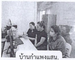
บ้านกำแพงแสน.