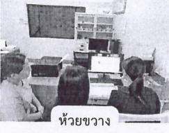
ห้วยขวาง