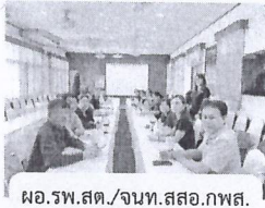
ผอ.รพ.สต./จนท.สตอ.ภพส.