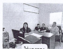
ไร่แดงทอง