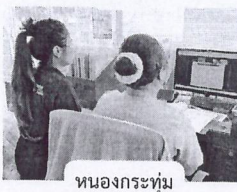
หนองกระทุ่ม