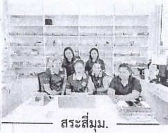
สระสีมูม.