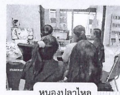
หนองปลาไหล