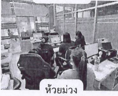
ห้วยม่วง